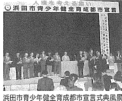
浜田市青少年健全育成都市宣言式典風景

施したのは、浜田市が初めてです。そういった意味でも都市宣言をしただけと言われないように、子供たちの未来を考えていきたいと思っております。