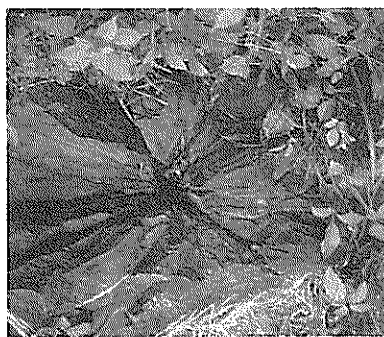
大変研究価値のある黄長石霞石玄武岩

日本で浜田市にしか存在しないものの一つに、この黄長石霞石玄武岩があります。これは、市内の熱田、長浜町の丘陵地帯に分布しているもので、そのうちの三ヶ所は天然記念物として指定されています。 これは、約百万年前の第四紀に噴出したもので、