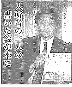
信楽町障害者厚生施設

四日市市にある産業廃棄物処理施設は、搬入物に対して非常に厳しい検査がなされていました。