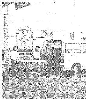
福祉センターを拠点に活動する移動入浴車

現在では、おっしゃる通り、委員会でも扱う問題が非常に多くなっており、いずれをとっても重要かつ生活の基本的な部分に関わる問題です。中でも新規の予算としては、「図書館・郷土資料館建設基金」があり、市