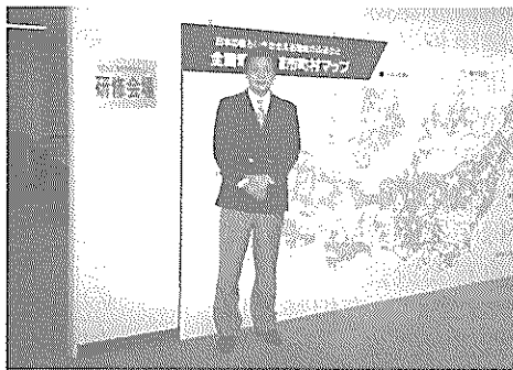
高齢者福祉研修の会場にて

今回は、東京の電源地域研修センターへ出向き、二泊三日の「高齢者福祉研修」を受講してきました。今後の介護保険実施準備のために活用していきたいと思えます。